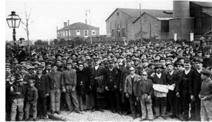
Sindicat d'obrers a Estats Units al s.XX

La música protesta neix als Estats Units en la dècada dels 30 del s.XX en els sindicats obrers , on van afegir noves lletres polititzades a velles tonades tradicionals amb la finalitat de crear himnes de solidaritat i protesta . Diversos sindicalistes i compositors de la cançó protesta van ser assassinats pels patrons que no estaven disposats a cedir els seus guanys i privilegis, uns altres van ser objecte de repressió per part de l'Estat. Encara que va néixer a EEUU, als països hispanoparlants i França la música protesta també va influir molt. Un gran desencadenant de moviments de música protesta a Europa va ser el Maig del 68' o Maig Francès . Van ser una sèrie de manifestacions organitzades per estudiants en contra de la societat capitalista, el imperialisme i l'autoritarisme. El Partit comunista es va unir als estudiants posteriorment i va ser considerada la major vaga a França fins el moment. Aquest moviment es va estendre ràpidament per tota Europa occidental i va inspirar els joves en grups polítics i sindicats a protestar. Molts d'ells van protestar amb música.