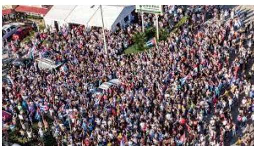
Manifestacions a cuba el 12/08/2021

A Cuba el passat juliol de 2021 va haver-hi moltes protestes i recorden que el combat ideològic també es disputa en la música amb cançons tant d'un bàndol com de l'altre.