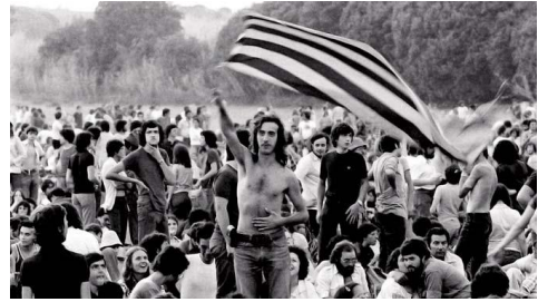
El moviment de “La Nova Cançó”

La Nova Cançó és el moviment artístic i musical català que, en ple franquisme , va impulsar la reivindicació de l'ús normal del català en el món de la cançó alhora que denunciava les injustícies de la dictadura franquista. Va començar a aparèixer a la segona meitat dels 50.