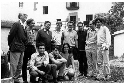
Membres de Ez Dok Amairu

Ez Dok Amairu va ser el nom d'un moviment cultural avantguardista basc que entre 1966 i 1972 es va dedicar a recuperar la cultura basca i renovar-la. Sorgit dins de