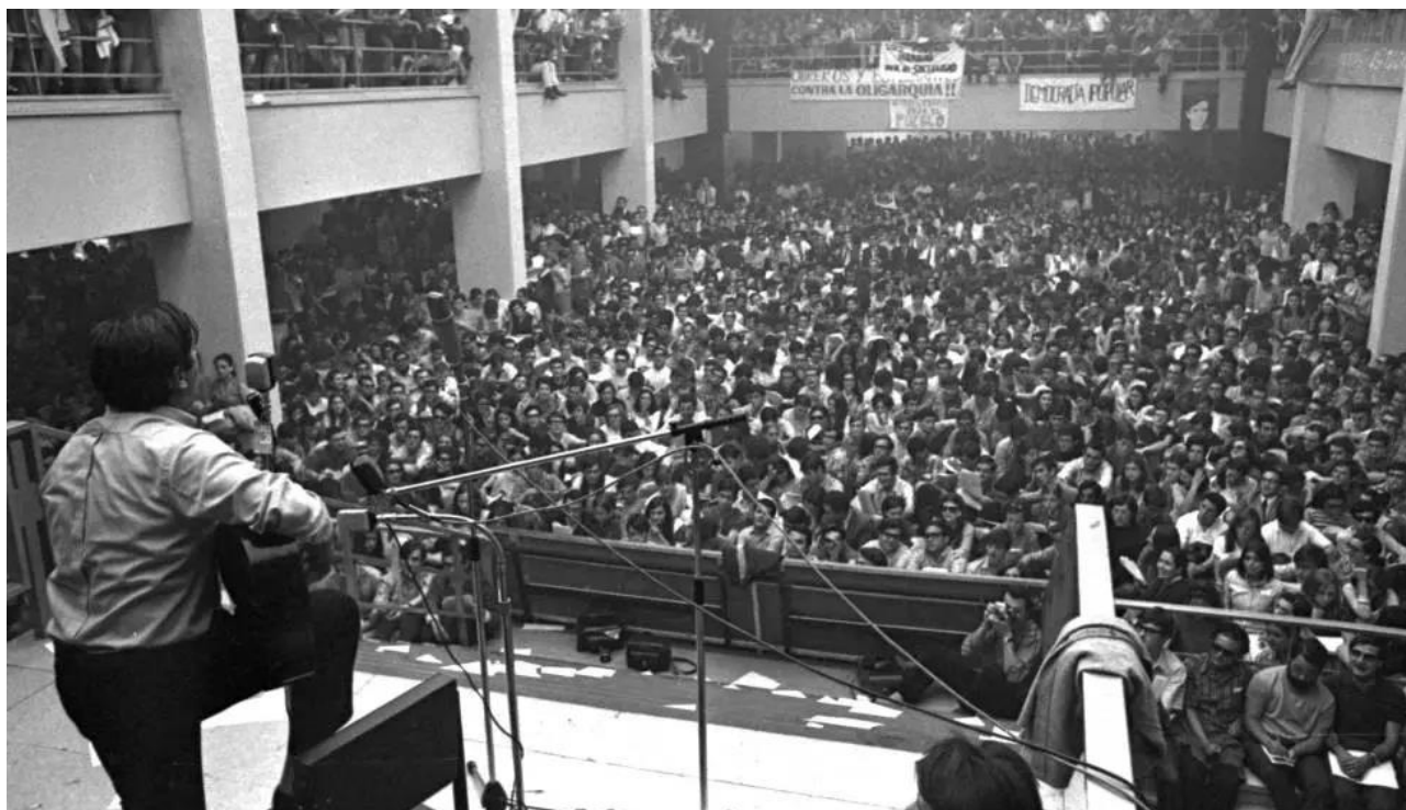
Concert de Raimon en 1968 en l'actual " Universidad Complutense de Madrid "