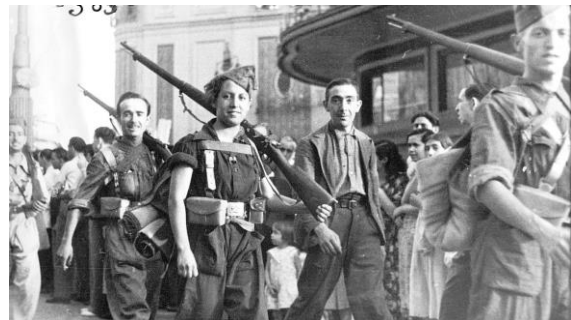
Militars en el bàndol republicà

Aquesta guerra va tenir dos bàndols, el republicà i el revoltat. El bàndol de la república va estar constituït entorn del Govern, format pel Front Popular, Partit Socialista Obrer Espanyol (al qual s'havien sumat el Partit Comunista d'Espanya i el POUM (Partit Obrer d'Unificació Marxista), el Partit Sindicalista i Esquerra Republicana de Catalunya. Era secundat pel moviment obrer i els sindicats UGT i