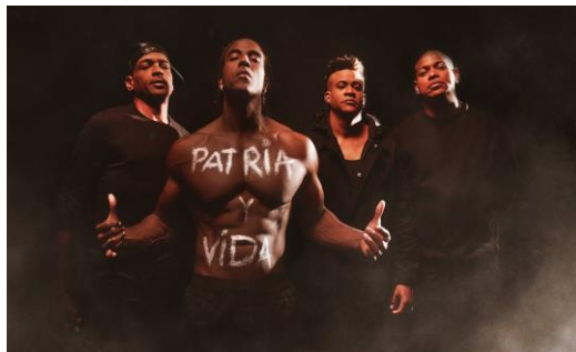
Cantants de Patria y vida

El moviment que ha desencadenat això ha estat el moviment Sant Isidre què és un moviment artístic i social de tall polític cubà, creat per un grup d'artistes i intel·lectuals que formen part de la denominada dissidència cubana, l'oposició al Partit Comunista de Cuba. El moviment compta amb el suport públic de diferents activistes de la dissidència cubana. Molts cantants i en general artistes cubans se sap que fan costat a aquest moviment i molts d'aquests han estat detinguts i tancats o exiliats. I amb això molts cantants com Gente de Zona, Descember Bueno, Yotuel, van fer una cançó per donar visibilitat al món dels problemes que estan passant Cuba.