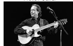
Joan Manel Serrat